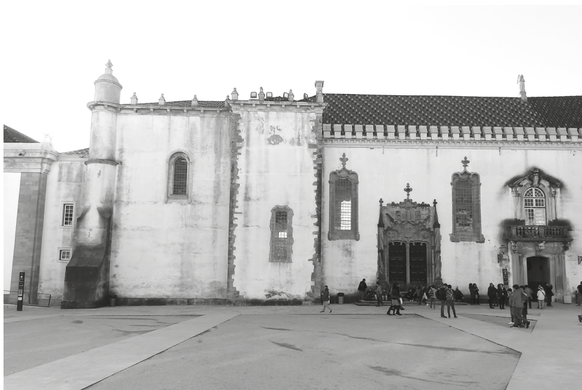
Fig. 3 – Capela de S. Miguel (atual capela da Universidade de Coimbra), fachada voltada ao terreiro.