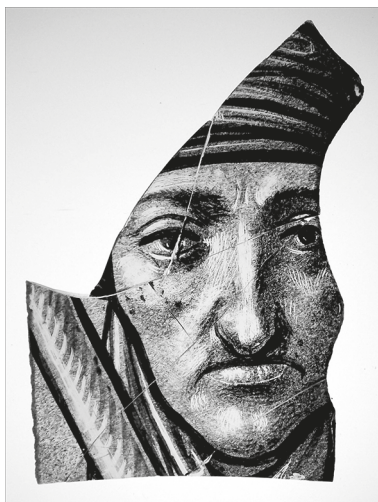
Fig. 2 – Fragmento de uma peça de vitral, representado a cabeça de uma figura com turbante, 1510-1518. Da charola do convento de Cristo, em Tomar.