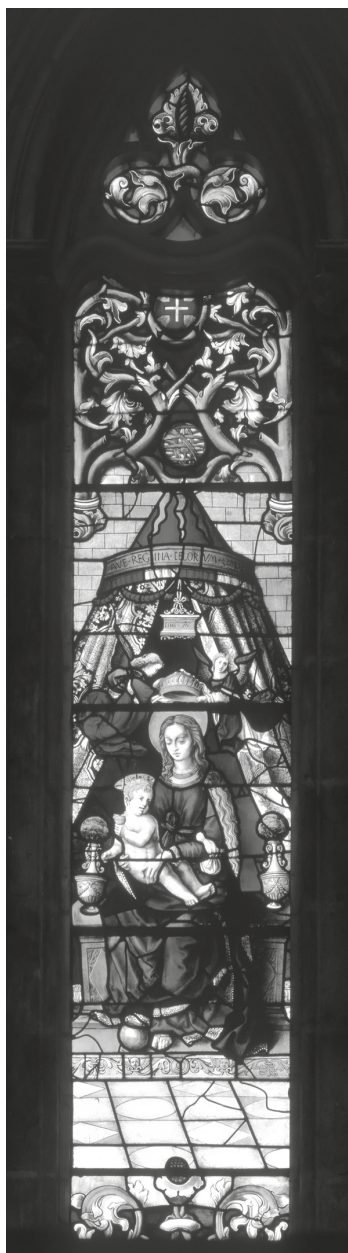
Fig. 4 – Pero Picardo (?), Virgem entronizada com o Menino, c. 1531. Capela-mor da igreja do mosteiro da Batalha.

tidão é a melhor janela de que dispomos, entre a documentação escrita conhecida, sobre a organização de uma empreitada, no nosso país, comparável, por exemplo, à da capela-mor e da sala do capítulo do mosteiro da Batalha, em relação à qual não se encontrou um único testemunho escrito mas que podemos conhecer através da análise das obras conservadas.