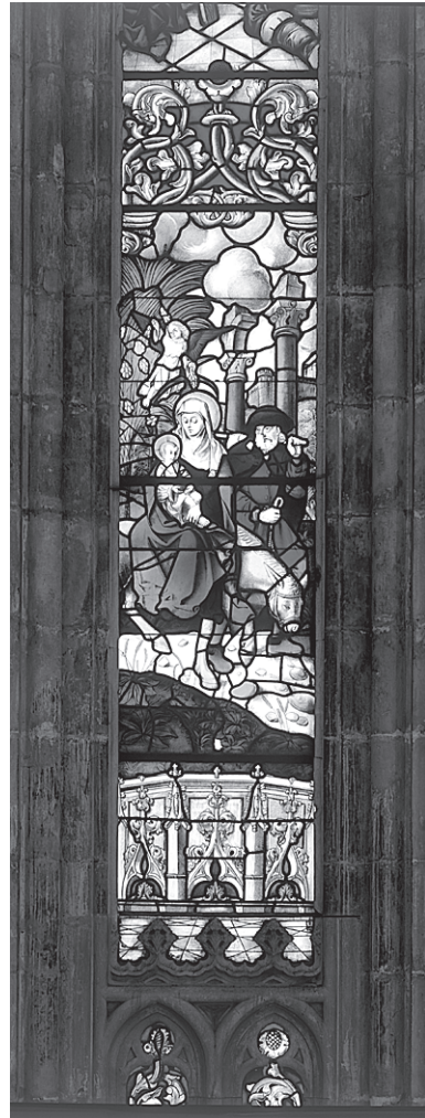
Fig. 16 – Fuga para o Egipto, final dos anos 20 ou início dos anos 30 do século XVI.