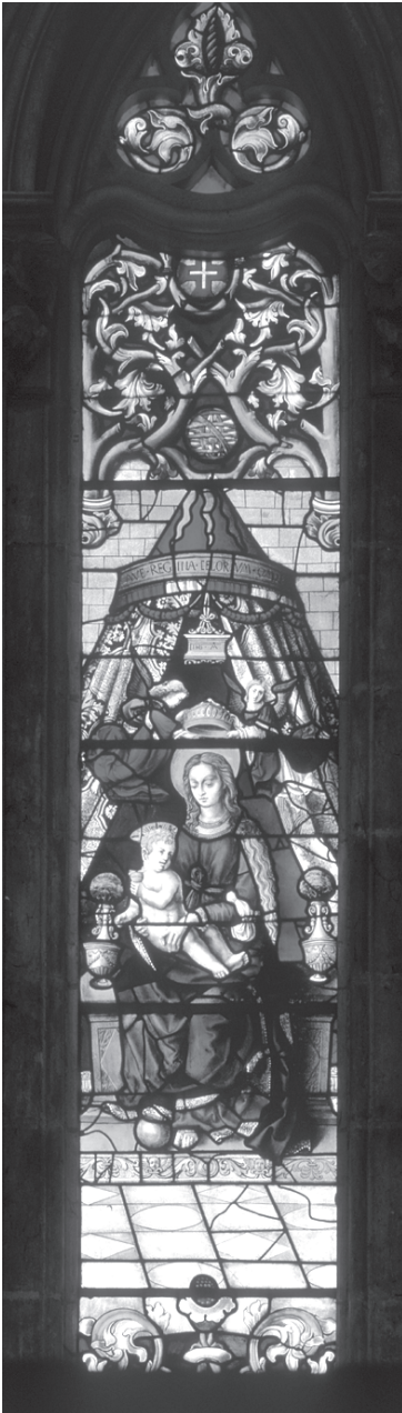
Fig. 17 – A Virgem entronizada com o Menino, final anos 20 ou início anos 30 do século XVI.

Embora não se encontre aí documentada a sua atividade, é possível que tivesse sido contratado para concluir o programa da capela-mor.