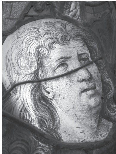
Fig. 13 – Pentecostes, pormenor, segunda década do século XVI.

O vitral de Nossa Senhora do Rosário (fig. 15) ilustra um modelo de representação divulgado nos finais do século XV: a Rainha dos Céus, como tal coroada, com o Menino ao colo segurando um rosário, aparece inscrita numa moldura de rosas que mais não é