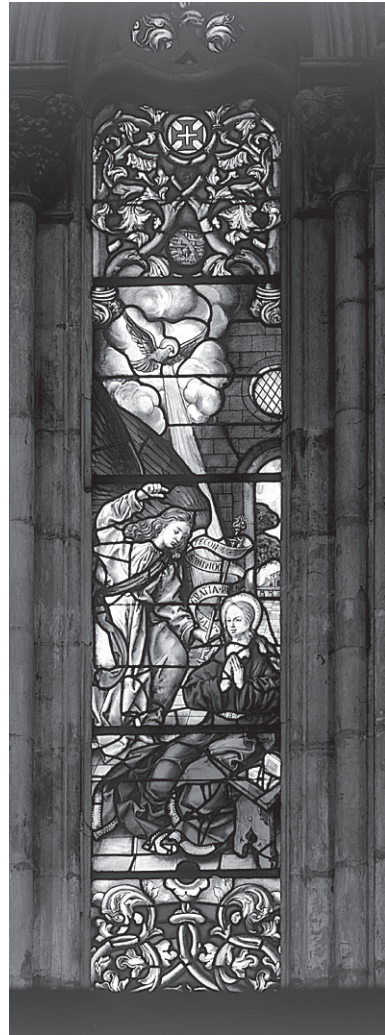
Fig. 14 – Anunciação, segunda década do século XVI.