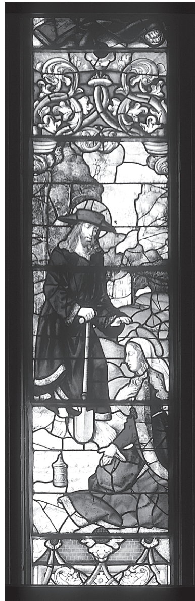
Fig. 9 – Aparição de Cristo a Maria Madalena, segunda década do século XVI.

As aparições de Cristo na terra, ao longo dos quarenta dias decorridos entre a Sua Ressurreição e a Ascensão, corroboram a doutrina da ressurreição. No Evangelho de S. João (20: 11-18), relata-se a aparição a Maria Madalena, no momento em que, confundindo Cristo com o hortelão, chorava à beira do sepulcro vazio. As Escrituras não fazem qualquer referência à aparição de Cristo a Sua Mãe, mas desde cedo se pensou que o facto não poderia ter deixado de se dar. As Meditações sobre a