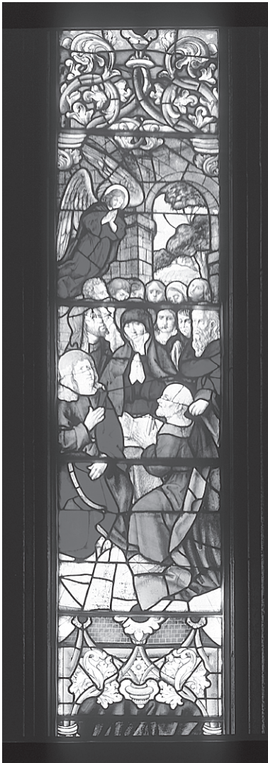
Fig. 12 – Pentecostes, segunda década do século XVI.

do que outro rosário. Pousa no crescente lunar, símbolo da sua castidade, e tem na mão direita uma rosa branca, sinal de pureza. Na base, vê-se uma fortaleza, alegoria das virtudes da Vir-