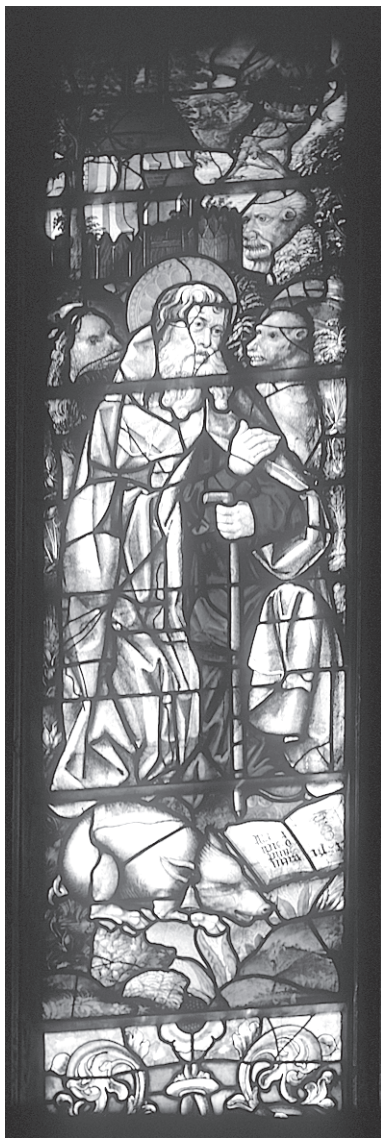
Fig. 7 – Santo Antão, segunda década do século XVI.