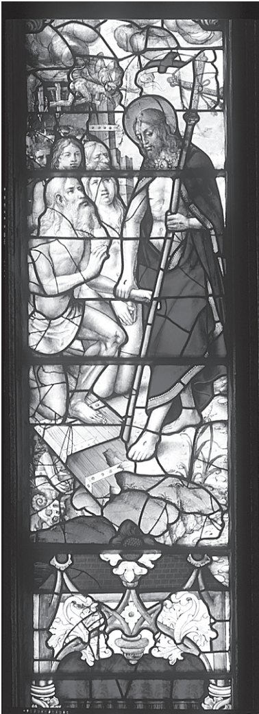
Fig. 8 – Descida ao limbo, segunda década do século XVI.

O tema da Descida ao limbo (fig. 8) remete para a dimensão cósmica do mistério pascal, subjacente a vários passos do Novo Testamento, mas não explícita sob as formas que assumirá nas artes visuais. De acordo com a cronologia bíblica, este tema estabelece a ligação entre as representações alusivas à Paixão de Cristo (muitas vezes patentes nas casa capitulares como sucede na Batalha) e a narração da Vida Gloriosa que se inicia com a Ressurreição. Em Portugal, o tema da descida de Cristo ao limbo não gozou provavelmente de grande popularidade nas séries retabulares. Uma gravura do alemão Martin Schongauer serviu de inspiração a Francisco Henriques, que aqui mostra a entrada estrondosa de Cristo ressuscitado na morada dos mortos, para terror das criaturas infernais e gáudio dos pecadores, com Adão – que Cristo segura pelo pulso – e Eva a liderar o respetivo cortejo.