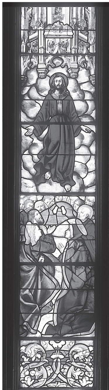
Fig. 11 – Ascensão, segunda década do século XVI.

A Anunciação da Batalha (fig. 14), de que se conserva apenas aproximadamente metade das peças originais, segue os esquemas gerais empregados para representar este tema na pintura portuguesa da época. O anjo Gabriel surpreende Maria, na quietude mística do aposento em que se encontram, anunciando que no seu seio encarnará Jesus (Lucas 1: 26-38). A agitação da extremidade da faixa verde que cinge a túnica do anjo acentua a paragem do voo e reforça a atmosfera de perplexidade e expectativa.